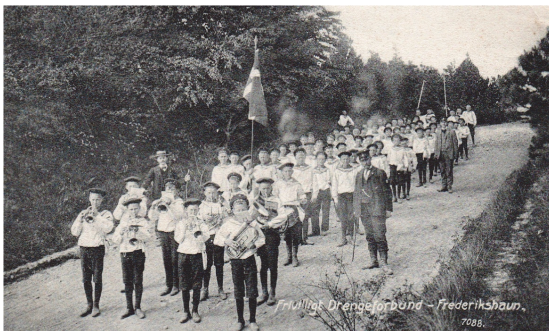
FDF Frederikshavn på marchtur i 1919.