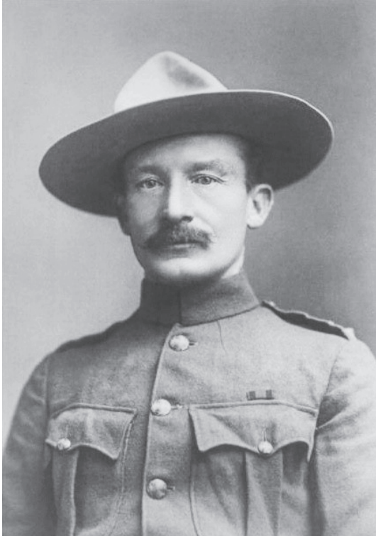
En ung Major-General Robert Stephenson Smyth Baden-Powell i 1896, under Matabelekrigen.