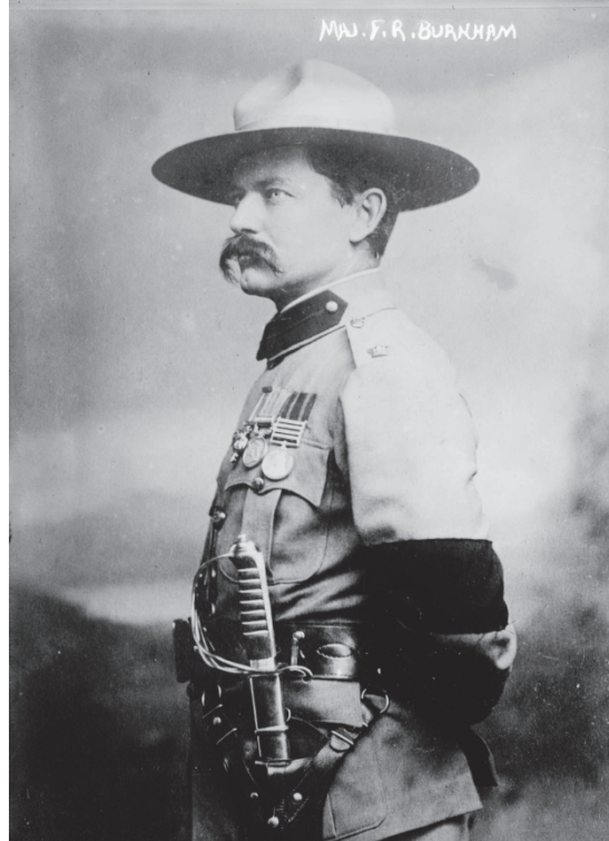
Major Frederick Russel Burnham. 1906.

Chefen for Baden-Powells spejder- og rekognosceringstropper hed Frederick Russell Burnham (Yale Archives - Burnham, 2021). Han var født og opvokset i et indianerreservat i Minnesota, hvor han som barn havde leget med indianerbørn fra sioux-stammen, og som teenager ernærede han sig som jæger og telegrafrytter i de Californiske ørkner. Allerede som 19-årig var han en erfaren stifinder, der jagede og blev jaget af apacheindianerne, inden han meldte sig som spejder i den britiske hær og kom under Baden-Powells kommando i Afrika. De to fik et tæt bånd, og Burnham var Baden-Powells store forbillede og lærerester, hvilket han aldrig lagde skjul på. Baden-Powell vidste meget om sporing og spejderarbejde set fra en militær synsvinkel, men på deres mange rekognosceringstogter i fjendtligt terræn lærte Burnham ham alt, hvad han selv havde lært som barn om indianernes livsstil og teknikker, deres færdigheder inden for sporfinding, navigation og overlevelse, hvilket alt sammen senere er blevet en stor del af det, man kalder spejderfærdigheder.