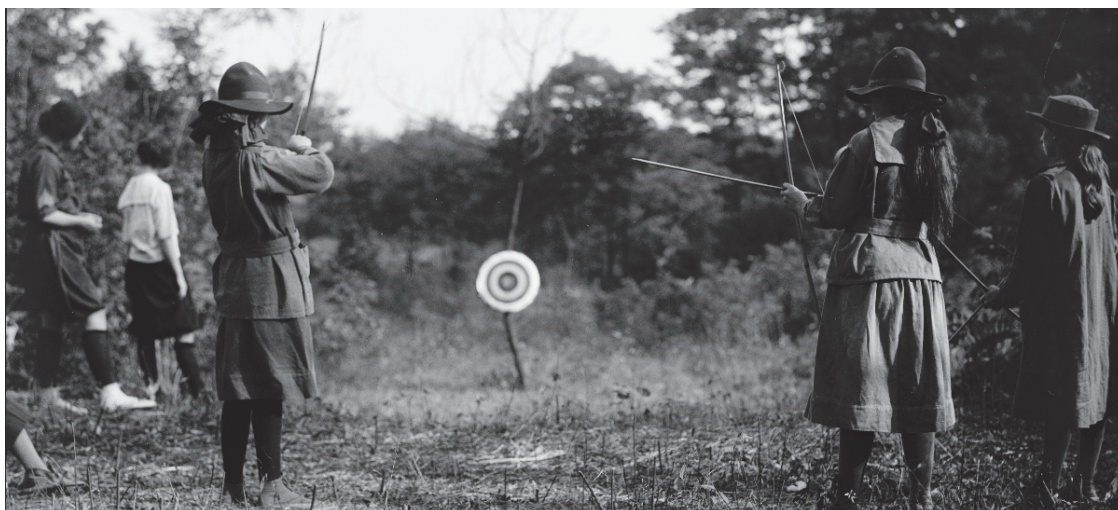
Engelske pigespejdere skyder med bue og pil. 1919.

Det var en tid, hvor det at piger sov i telt, gik med dolk og var iklædt uniform var meget nyt – så det skal ikke underkendes, at det virkeligt har krævet stærke piger og progressive forældre at tage de første skridt ind i en ellers mandsdomineret spejderverden.