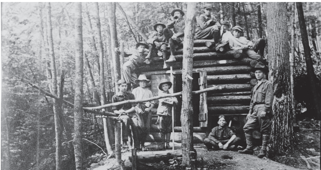
Amerikanske drengespejdere foran en hjemmebygget bjælkehytte. Årstal ukendt.