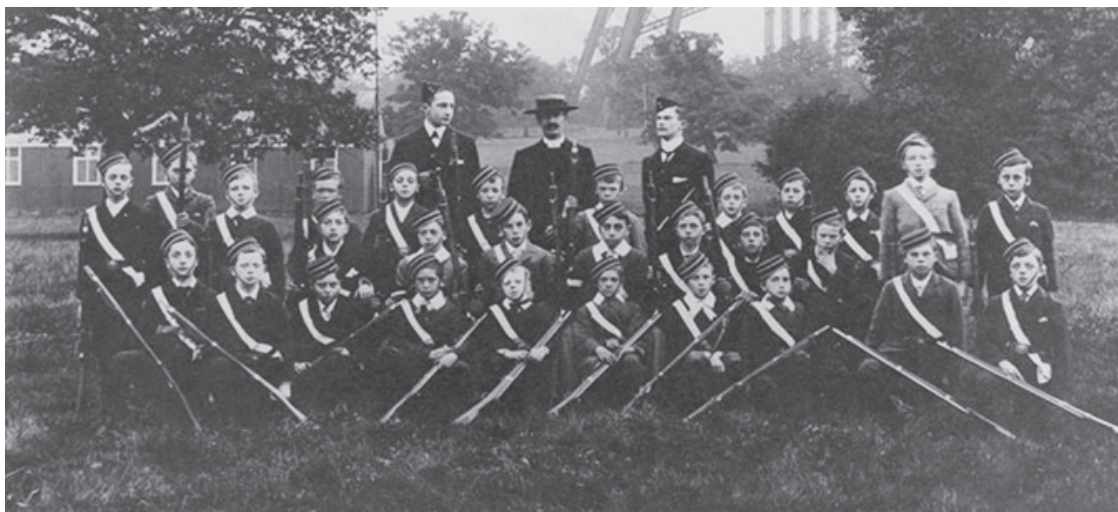
Boys Brigade fra Wembley. Årstal ukendt.

Boys' Brigade blev stiftet den 4. oktober 1883 i Glasgow. Dette var verdens første frivillige, uniformerede ungdomsorganisation, og idéerne spredte sig ud over hele det engelske imperie. Stifteren, William Alexander Smith, var en ung mand, der boede i Glasgow, og som var meget aktiv i frivillige korps og foreninger (National Records of Scotland, 2021). Som ganske ung meldte han sig ind i både Free Church of Scotland, YMCA og Lanarkshire Rifle Volunteers, hvor han allerede som 19-årig blev udnævnt Lance-Corporal.