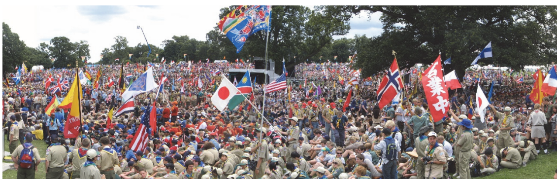
Spejdere fra hele verdenen, til åbningen af den 23. verdensjamboree.

FDF har ikke på samme måde en international 'moderorganisation', da det udelukkende er et dansk fænomen. FDF er dog medlem af forskellige internationale netværk: Global Fellowship og European Fellowship, som er netværk for kristne børne- og ungdomsorganisationer, og så har de observatørstatus i FIMCAP, som er en sammenslutning af katolske børne- og ungdomsorganisationer. Formålet med FDF's internationale arbejde er at kunne skabe møder mellem mennesker – ikke bare som turister, men som ligesindede og dog forskellige mennesker, der mødes om evangeliet om Jesus Kristus. I denne forbindelse har FDF også tradition for at drive forskellige missionsprojekter, ligesom de har en afdeling kaldet CrossCulture, hvis formål er at give FDF'ere mulighed for at opleve mangfoldigheden i forskellige kulturer (fdf.dk - Internationalt, 2021).