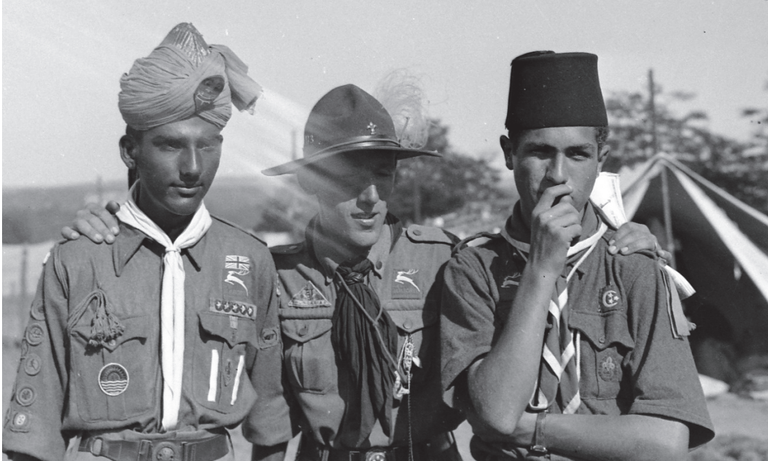
En indisk, engelsk og tyrkisk spejder på den fjerde Verdens Jamboree i Budapest i 1933.

Oprindeligt havde Baden-Powell ingen intentioner om at bryde ud af Boys' Brigade. Han ønskede blot at reformere deres arbejde, hvilket skete ved, at han forsøgsvist, lod få grupper og sektioner under Boys' Brigade arbejde ud fra sine egne idéer og visioner. Eftersom spejderbevægelsen voksede eksplosivt, især uden for Boys' Brigades organisation, blev det nødvendigt at oprette først et kontor og i 1910 en selvstændig organisation for at støtte og organisere det frivillige arbejde.