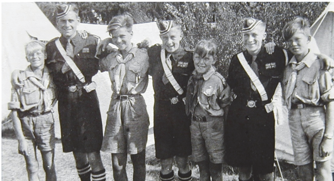
Et hold fra Boy's Brigade (mørke uniformer) deltager på en FDF-landslejr. Læg mærke til FDF'ernes væbneruniform.