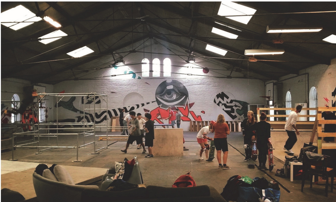
Parkour i Ungdomskulturhusets hal.