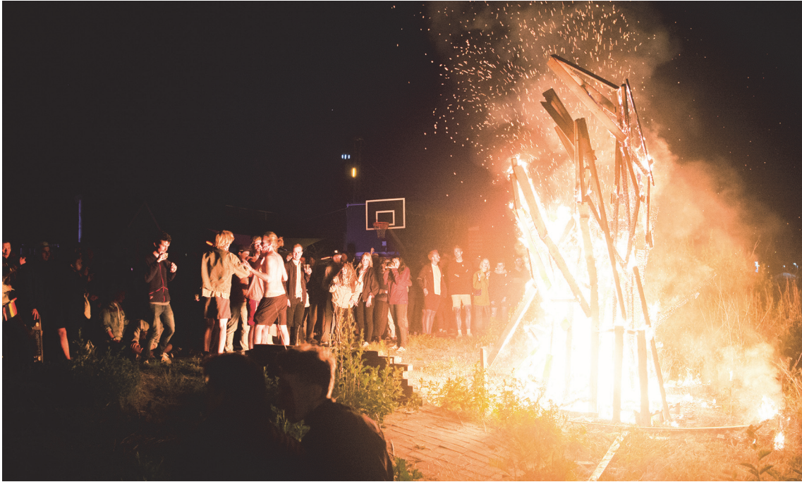
En af masterclassdeltagerne havde bygget en stor hånd i træ, som til sidst på gadefesten blev brændt af.