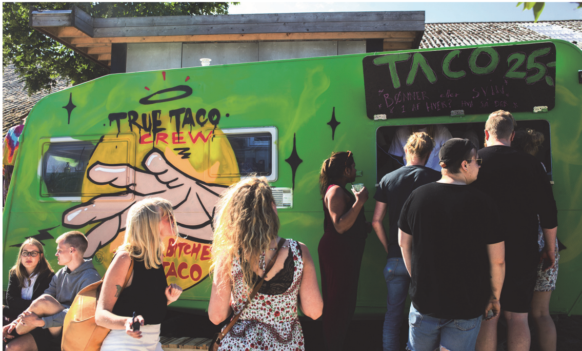
Blandt masterclassprojekterne var denne tacovogn, som to af deltagerne driver en lille forretning med. De havde i denne sammenhæng videreudviklet på deres koncept.

De faste moduler og undervisningsdage blev som nævnt suppleret med ad hoc vejledning og arbejdsgrupper. For eksempel blev der afholdt en ekstra dag om fundraising, hvor projektlederen sammen med tre frivillige deltagere søgte Kulturstyrelsens ungepulje for nationale events.