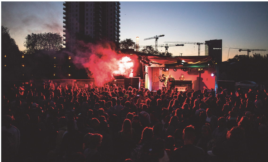
Stemmingsbillede fra gadefesten Aarhus Volume den 11. juni 2016.

'Gadefesten' er det første arrangement i foreningens regi, men på længere sigt er det meningen, at foreningen skal afholde flere kulturelle aktiviteter. Et af projekterne var på interviewtidspunktet at søge at skabe et helt nyt spillested på Godsbanen.