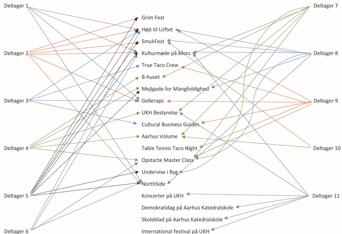
Figur 1: Masterclassdeltagernes "fælles frivillig-CV" for det seneste år

Trods de mange lighedspunkter rummer gruppen også forskelle.