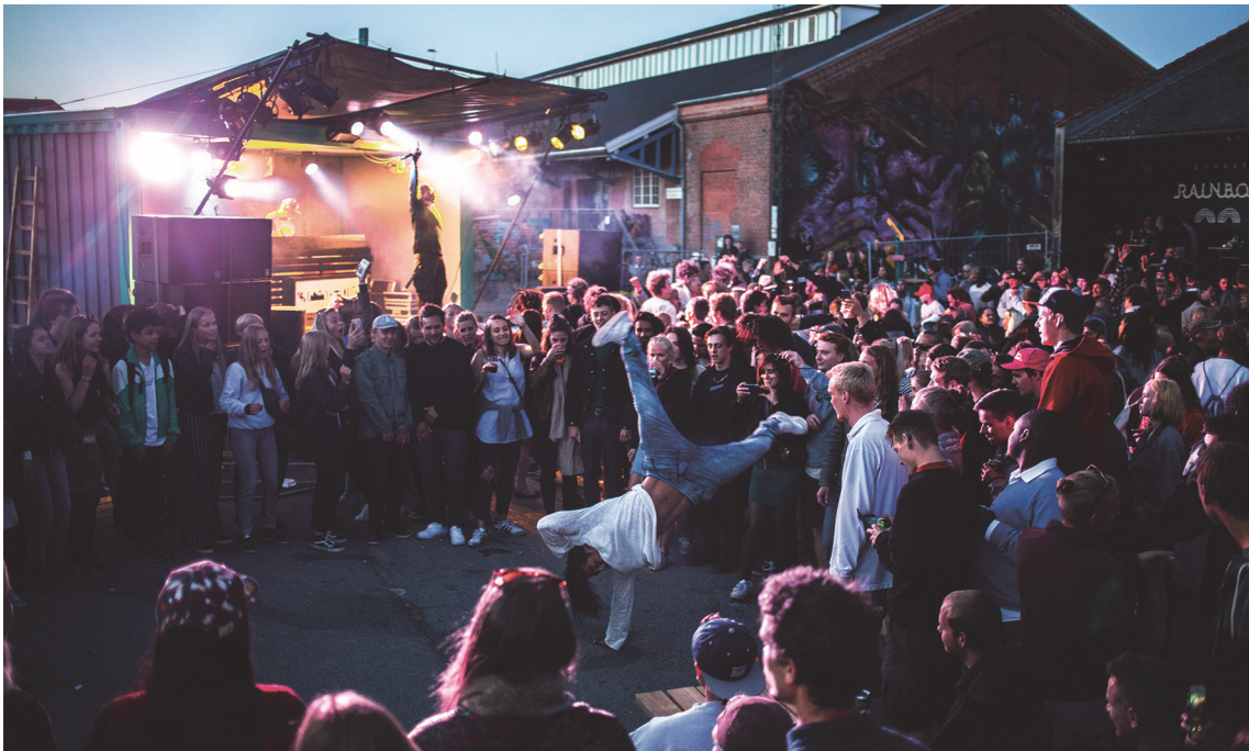
Stemningsbillede fra gadefesten Aarhus Volume den 11. juni 2016.

Alt i alt resulterede det i en Gadefest, som spredte sig ud over hele Godsbanen. Musikstilen varierede mellem de forskellige scener, og hele arrangementet tiltrak folk i alle aldre i løbet af dagen og blev senere 'overtaget' af det yngre segment. Udover Aarhus Volumes egen efterfest var der efterfest i Double Rainbow og Radar. Samme armbånd gav adgang til alle tre fester.