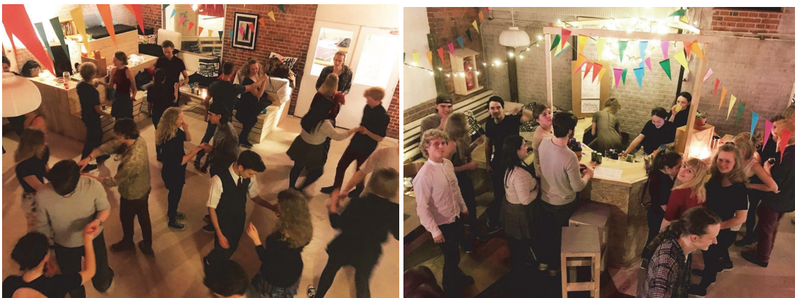
Salsaften i Ungdomskulturhuset.