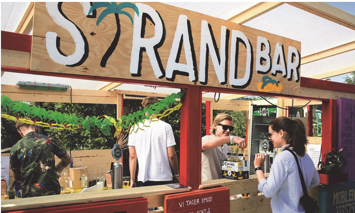
Her ses en af de temabarer, som en gruppe blandt masterclassdeltagerne udviklede.